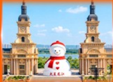
ตึกตาสหิมะยักษ์ ฮาร์บิน