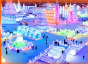
เที่ยว ICE & SNOW WORLD