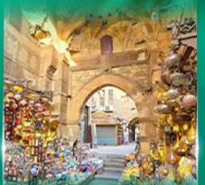
ตลาดท่านเอลกาลลี