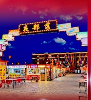
ตลาดกลางคืน ตาลาเดอดี