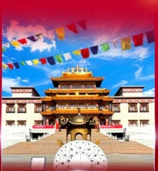
วัดพระโพธิสัตว์ อูลาน