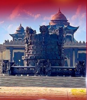
ศูนย์วัฒนธรรม มองโกเลีย หยวนหลิว