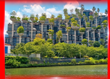
ตึก 1,000 ต้นไม้