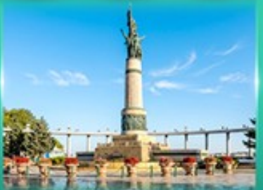
อนุสาวรีย์นิ่มหง