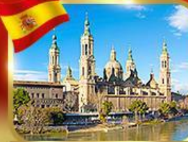
วิหารพระแม่มาเรีย ซาราโกซา