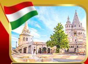
ปิอชชาวประมงเมืองบูดาเปสต์