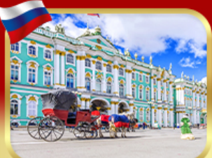
เช่าชมพิพิธภัณฑ์ออร์มิทา