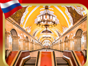
สถานีรถไฟใต้ดินกรุงมอสโก