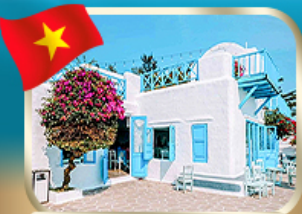
คาเฟ่สไตล์ชิคาโกที่ ซันทรา เทริน่า