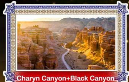
Charyn Canyon+Black Canyon