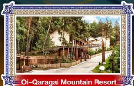
Oi-Qaragai Mountain Resort