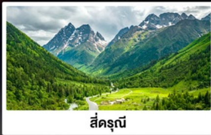
สี่ครุณี