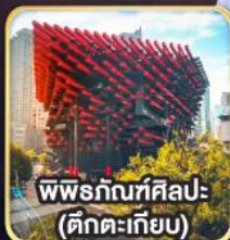
พิพิธภัณฑ์ศิลปะ- (ตึกตะเกียบ)