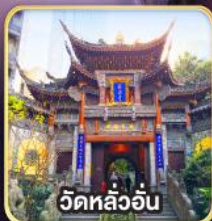
วัดหลัวอัน