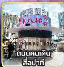
ถนนคนเดิน สี่ป่าทิ