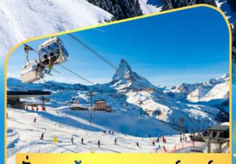
นั่งกระเช้าชมแมกเทอร์ฮอร์น