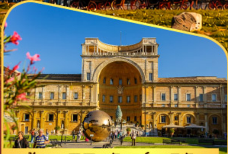
เข้าชมพีพีรภัณฑที่วาติกัน