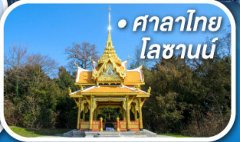
• ศาลาไทย โลซานน์

• สุดอากาศดีดีที่ซอร์แมก • ขึ้นกระเช้าสู่ยอดจากกลาเซียร์ 3000 • ชมเมืองคลาสสิกเบิร์น ลูเซิร์น ซูริค