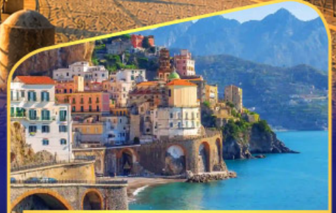
ชมวิวมอลฟีโคสก์