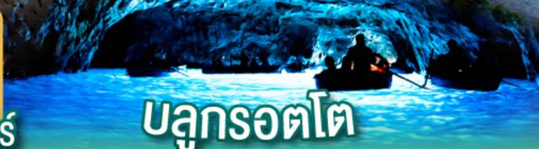
บลูกรอตโต

พิเศษ!! ล่องเรือไฮโดรฟอยด์สู่เกาะคาปรี ชมบลูกรอตโต และดินแดน 5 หมู่บ้านซิงเกวแตรีน