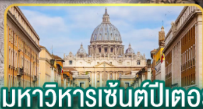
มหาวิหารเซ็นต์ปีเตอร์