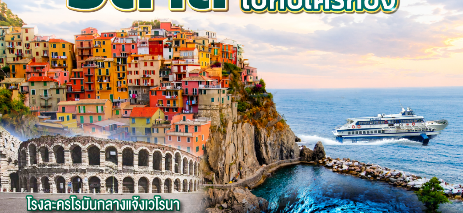
โรงละครโรมันกลางแจ้งเวโรนา