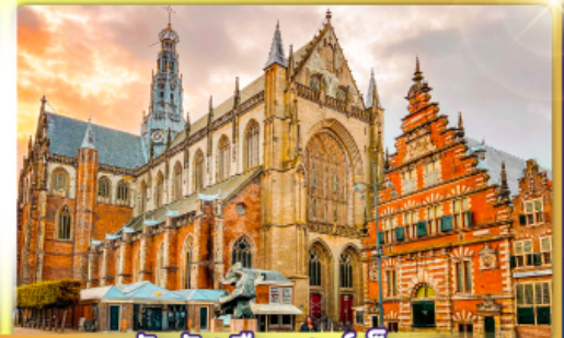
จัตุรัสเมืองฮาร์ลิม

พรมแดนเมืองเปลกาเนเธอร์แลนด์และเบลเยียม เดินเมืองเคลฟท์ เมืองเครื่องปั้นดินเผาระดับโลก ฮาร์ลิมเมืองมั่งคั่งที่สุดของเนเธอร์แลนด์