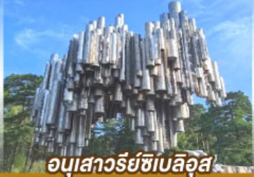
อนุสาวรีย์ซีเบลึอุส