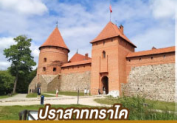
ปราสาททราโค