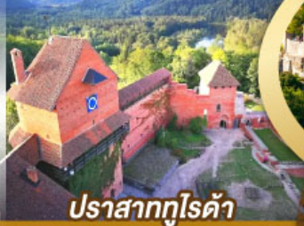
ปราสาทกูโรต้า