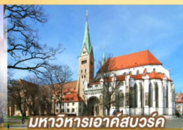
มหาวิหารเอาค์สบวร์ค