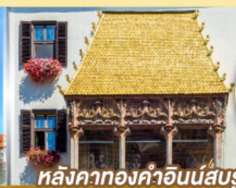
หลังคาทองคำอินน์สบวร์ค