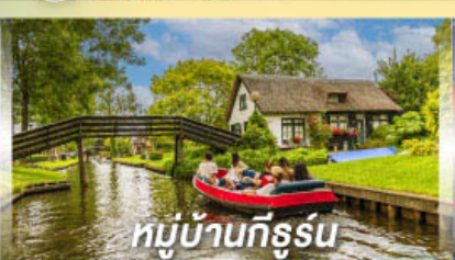
หมู่บ้านทีร์รูน