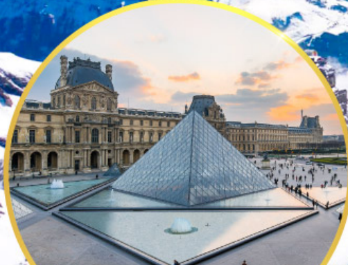
ถ่ายรูปคู่พีพีรกันที่ลูฟร์