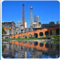
Eastern Suburb Memory Chengdu