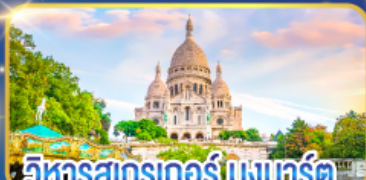
วิหารสกรเกอร์ มงมาร์ต