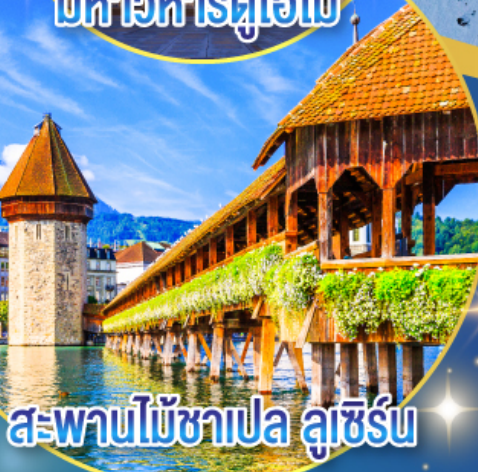
สะพานไม้ชาเปล ลูเซิร์น