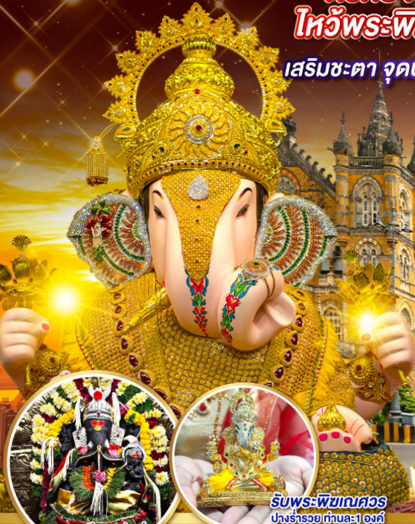
พระตรีศูล ปูณ (Trishul Pune)

เสริมชะตา จุดปญญา มุสุดบึง มหานครมุมไบ ปูณ