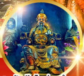
วัดปักโต้อ่องอำ