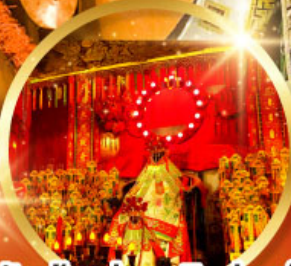
วัดเจ้าแม่กวนอิมอ่องอำ (สวนหนานหลิน)