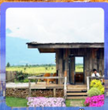
ร้านกาแฟหุบเขาคี๊อัน