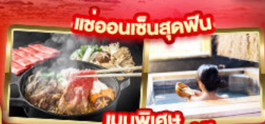
เขื่อนเซ็นสุคัพ