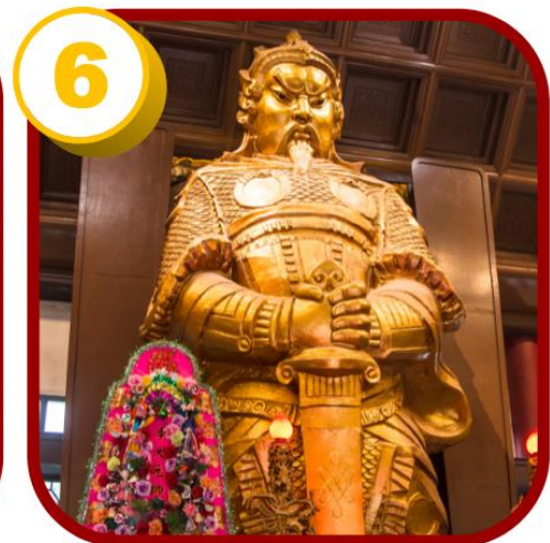
วัดแชกง (ซ่าถิ้น)