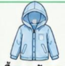
เสื้อคลุมกันแดด/ กันลมบางๆ