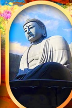
เมืองดาอิบุตสึแห่งพระพุทธรเจ้า