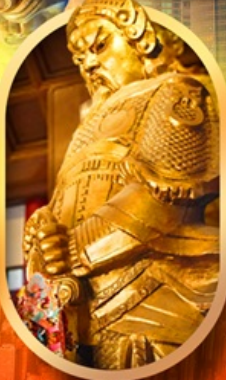
เทพวัดแชกง

เที่ยว 2 ประเทศ 4 พอร์ 4 วัดดัง ช้อปปิ้งจุใจ