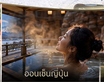
ออนเซ็นญี่ปุ่น