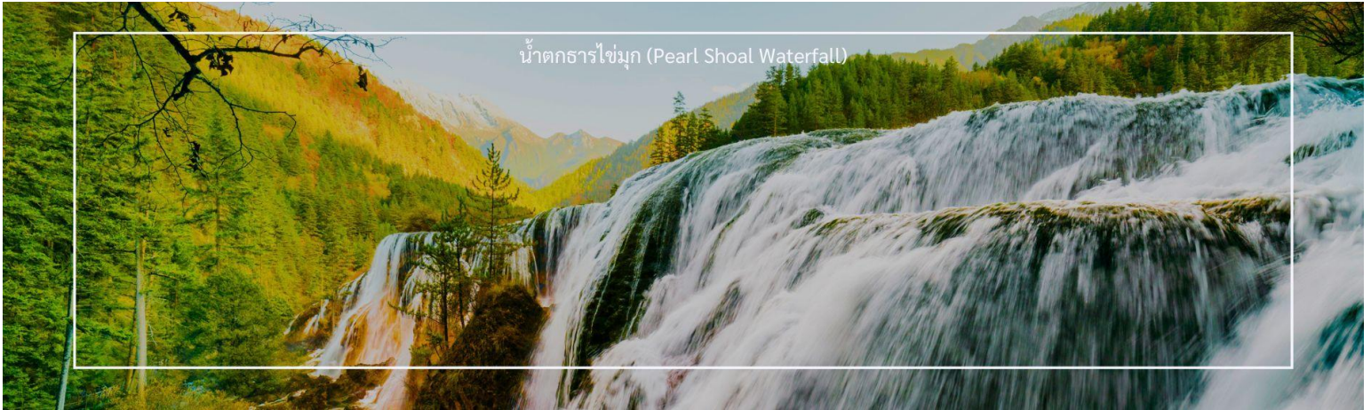
น้ำตกธารไข่มุก (Pearl Shoal Waterfall)

ชื่อของน้ำตกแห่งนี้มาจากรูปร่างของน้ำตกที่ไหลลงมาเป็นชั้นๆ คล้ายสายไข่มุกที่เปล่งประกาย น้ำตก Pearl Shoal เป็นน้ำตกที่ใหญ่ที่สุดในอุทยานแห่งชาติจิว่จ้ายโกว มีรูปร่างคล้ายพัด กว้าง 160 เมตร สูงจากระดับน้ำทะเล 2,433 เมตร น้ำไหลลงมายาว 310 เมตร นอกจากนี้ยังเคยเป็นสถานที่ถ่ายทำภาพยนตร์เรื่อง Journey to the West อีกด้วย