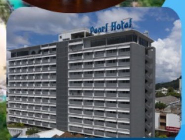
ภูเก็ตเมืองเก่า