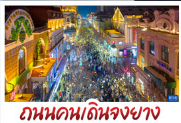
ถนนคนเดินจงยาง