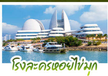
โรงละครเวนิซใหม่