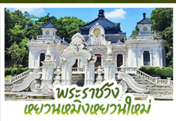
พระราชวัง เซวณเหมิงเซวณฮีเหม่