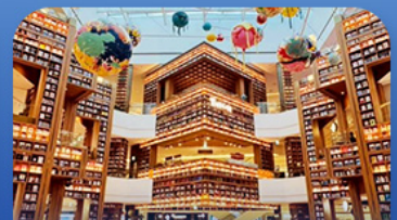
ต๋องสมุดสตาร์ฟิค