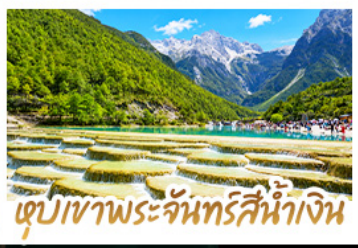
ตู่เปาพระจันทร์สีน้ำเงิน