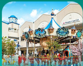
ลิวตเต้ ไอท์เกิ้ล