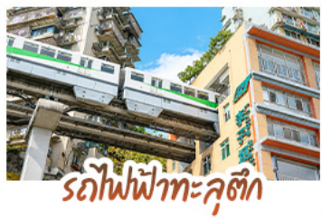
รถไฟฟ้าทะเลสาบสี่จ้อป้า

ชมธรรมชาติ ณ อู่หลง ชมหุบเขาสุดอลังการระดับมรดกโลก นั่งรถไฟฟ้าทะเลสาบสี่จ้อป้า สัญลักษณ์เมืองจงชิ่งสุดล้ำ สัมผัสวิถีภูเขาหิมะแห่ง ภูเขาสัตว์จีน งดงามจนได้รับฉายา “เทือกเขาแอลป์แห่งตะวันออก” ชมธรรมชาติสุดฟิน ณ อุทยานป่าเผิงโกว • ซ้อปโป่งจู่ใจ ถนนคนเดินไท่กู่หลี่, ถนนคนเดินซุนชื้อ