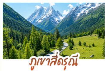
ภูเขาสัตว์จีน