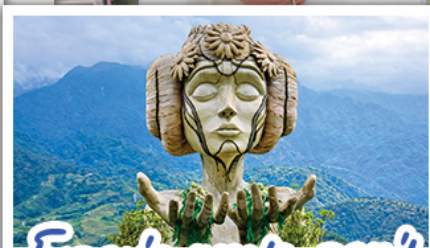
ไมอาน่า ซาปา ดาเฟ