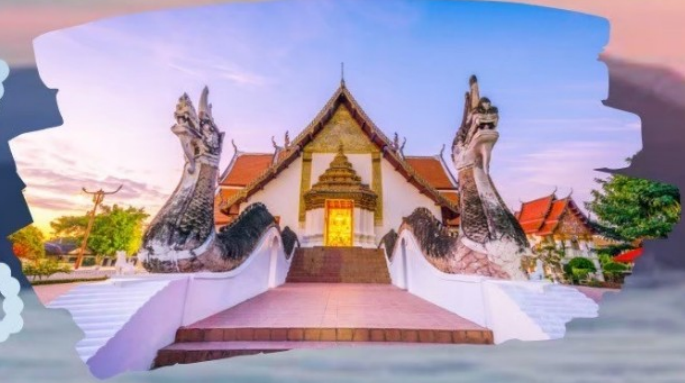
วัดกุ่มินทร์