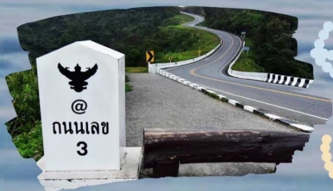
ถนนหมายเลข 3