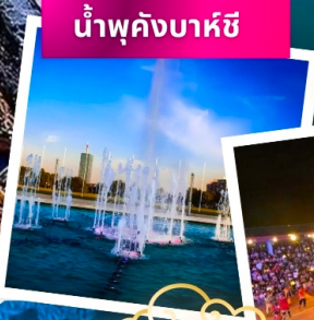
น้ำพุคังบาหซี