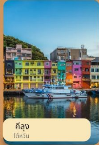
คิงลุง ไต้หวัน