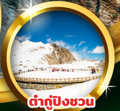
ต่ากู่ปิงชว่น