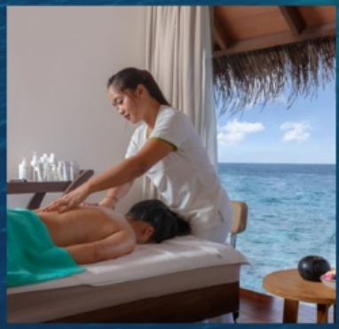
SPA 30 Mins