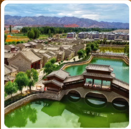
หมู่บ้านตันซีซิว