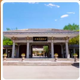
อุทยานประวัติศาสตร์จิวจวน