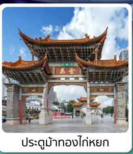
ประตูม้าทองไค่หยก