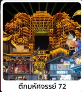
ตีทมหัศจรรย์ 72